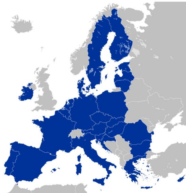
Lidstaten Europese Unie vanaf 1 februari 2020

Lidstaten Europese Unie vanaf 1 februari 2020